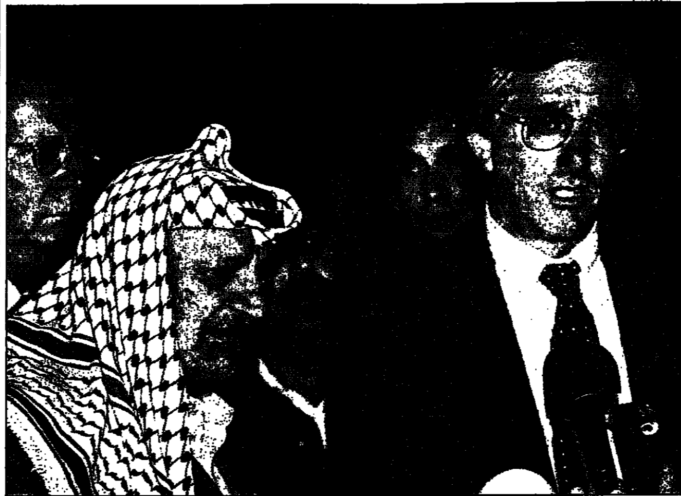
عزت روس ويصعدان للمصلحين بعد اجتماعهما في رام الله

بمسئولية الفلسطينيين للحادثات دون تجميد أنشطة الاستيطان. وقالوا ان اجتمعا فلسطينيا اسرائيليا سيكون غير فعال دون ضغوط امريكية مباشرة على اسرائيل لوقف البناء، غير ان موشيه فوجل المتحدث باسم حكومة اسرائيل قال ان اسرائيل مستمرة في بناء المستوطنات. والمسؤولون الفلسطينيون والاسرائيليون يحقون بشأن القضايا التي سيبحثها الاجتماع، ويعد الاتفاق الفلسطيني.